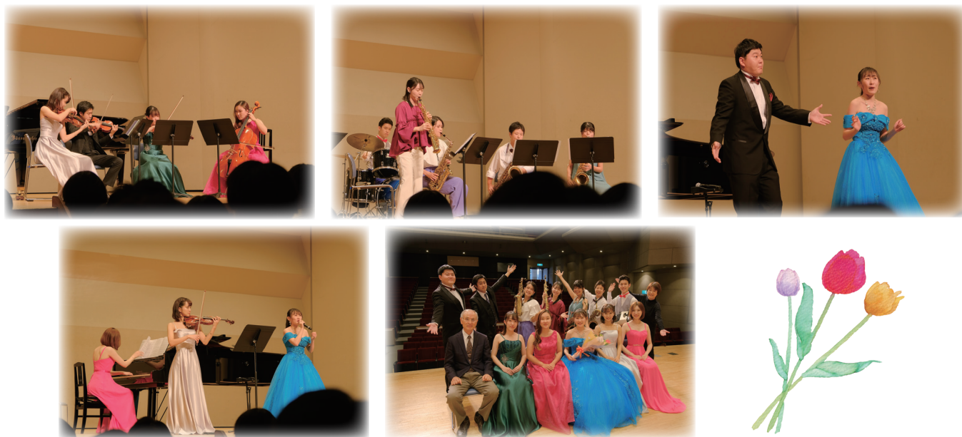
兵庫県立山崎高等学校芸術鑑賞会の模様(山崎文化会館)